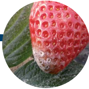
Botritis en fresa