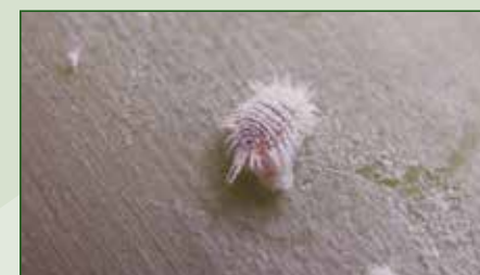
Dysmicoccus grassii , Tejina, 2 aplicaciones, 41 días de intervalo Volumen de agua: 3.000 L/ha Control: % Superficie cubierta 14

Movento® Gold es principalmente activo sobre estadios jóvenes. Se recomienda el uso al inicio de la infestación de la plaga.