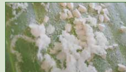
Aleurodicus dispersus , Tejina, 2 aplicaciones, 41 días de intervalo Volumen de agua: 3.000 L/ha Control: Insectos/hoja 39

Es importante efectuar monitoreos y hacer los tratamientos cuando se detecten las primeras ninfas. Las hembras adultas tratadas muestran una reducción en la fecundidad (menor cantidad de huevos) y en la fertilidad (menos huevos viables).