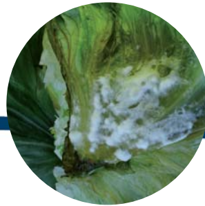
Esclerotinia en lechuga